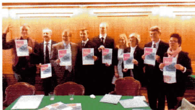
Un momento della conferenza stampa di presentazione del concerto benefico "The Beatles Vs The Rolling Stones" che si terrà il 27 marzo 2015.

L'evento è promosso da Rotary Club Novara con l'obiettivo di sostenere AIEF Onlus in un progetto ambizioso.